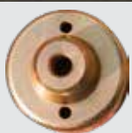
Cloche de carottage