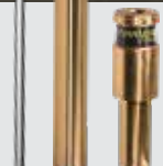
Super-Set de pre-perforage