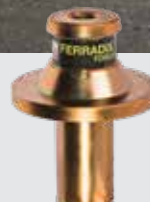
Mouton de battage