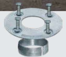
Kit de serrage